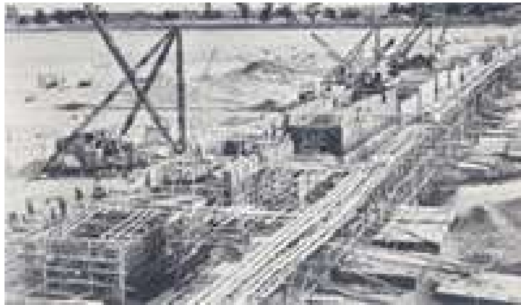
昭和27年の建設風景