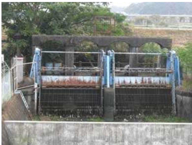
旧大井川サイホンの呑口