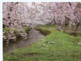
題名:「花盛り」 撮影場所:青森県弘前市 疏水名:岩木川右岸用水路