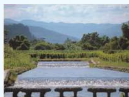
題名:「水のきらめき」 撮影場所:山形県寒河江市 疏水名:高松堰