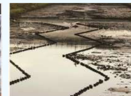
題名:「水面の稲妻」 撮影場所:京都府久世郡久御山町 疏水名:巨棕池排水幹線