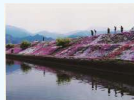
題名:「春の水辺」 撮影場所:愛媛県西条市 疏水名:西条市禎瑞地区農業用水路