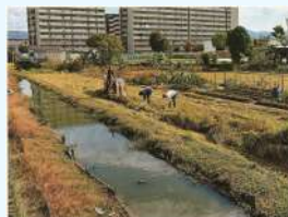
題名:「用水路の秋収穫」 撮影場所:大阪府門真市 疏水名:北島用水