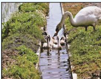
■ 題名:「親子のふれあい咲いて」 ■ 撮影場所:福島県いわき市