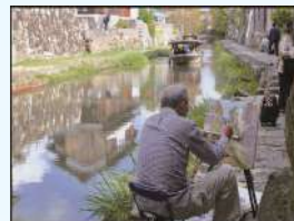
題名:「春の水辺」 撮影場所:滋賀県近江八幡市 疏水名:八幡堀