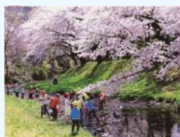
題名:「水温む」 撮影場所:東京都立川市 疏水名:根川