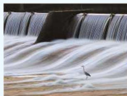
題名:「静かな刻」 撮影場所:熊本県玉名郡和水町 疏水名:白石堰