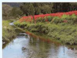
題名:「槻川を彩る」 撮影場所:埼玉県比企郡東秩父村 疏水名:槻川