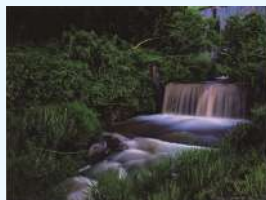
題名:「煌めきを信じ」 撮影場所:長野県長野市 疏水名:浅川