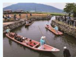
題名:「風流、舟の旅」 撮影場所:滋賀県近江八幡市 疏水名:安土川