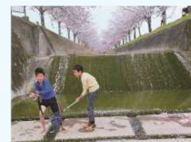
題名:「水めるむ頃」 撮影場所:兵庫県加古郡稲美町 疏水名:曇川