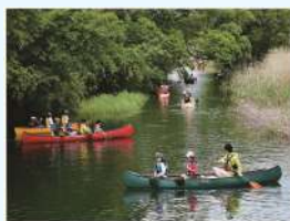
題名:「みんなで楽しくゴミ拾い」 撮影場所:埼玉県鴻巣市 疏水名:元荒川榎戸堰