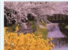
題名:「咲き溢れる春」 撮影場所:埼玉県さいたま市 疏水名:見沼代用水