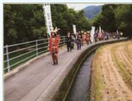
題名:「武者行列が行く」 撮影場所:徳島県三好市 疏水名:三村用水