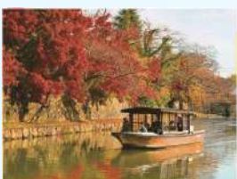
題名:「ゆらりゆらりと」 撮影場所:滋賀県近江八幡市 撮影者:石川 満彦(山口県) 疏水名:琵琶湖疏水