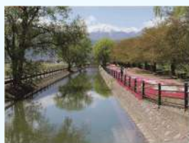
題名:「拾ヶ堰の春」 撮影場所:長野県安曇野市 疏水名:拾ヶ堰