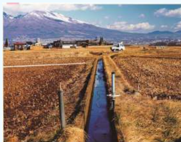
■ 題名:「美田の里」 ■ 撮影場所:長野県佐久市 ■ 撮影者:太田 誠一(長野県) ■ 疏水名:五郎兵衛用水