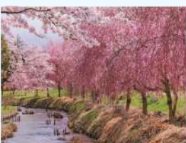
題名:「華やかな散歩道で」 撮影場所:長野県長野市 疏水名:善光寺平用水